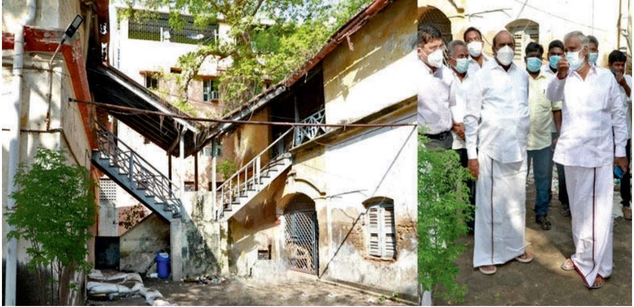
மாண்புமிகு பொதுப்பணித் துறை அமைச்சர் அவர்கள், சென்னை சவுக்கார் பேட்டை டெவிட்சன் சாலையில் உள்ள சார்பதிவாளர் அலுவலகத்தை ஆய்வு செய்தார்.