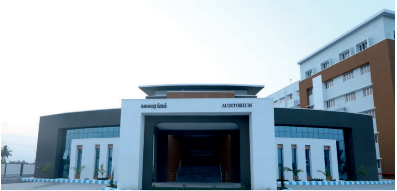
கள்ளக்குறிச்சி அரசு மருத்துவ கல்லூரி கலையரங்கம் திறக்கப்பட்ட நாள் : 12.01.2022