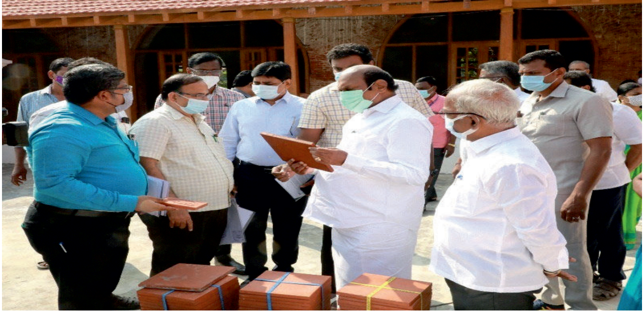
மாண்புமிகு பொதுப்பணித் துறை அமைச்சர் அவர்கள் சென்னை சேப்பாக்கத்தில் தீயினால் சேதமடைந்த “ஹுமாயூன் மஹால்” பாரம்பரிய கட்டட புனரமைப்பு பணியினை ஆய்வு செய்தார்