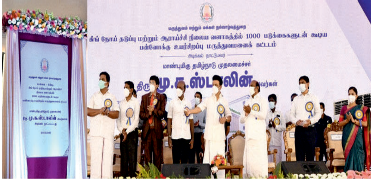
மாண்புமிகு தமிழ்நாடு முதலமைச்சர் திரு. மு. க. ஸ்டாலின் அவர்கள் 21.03.2022 அன்று சென்னை கிண்டி, கிங் நோய் தடுப்பு மற்றும் ஆராய்ச்சி நிலைய வளாகத்தில் ரூ.230 கோடி மதிப்பீட்டில் கட்டப்படவுள்ள பன்னோக்கு உயர் சிறப்பு மருத்துவமனைக்கு அடிக்கல் நாட்டினார்