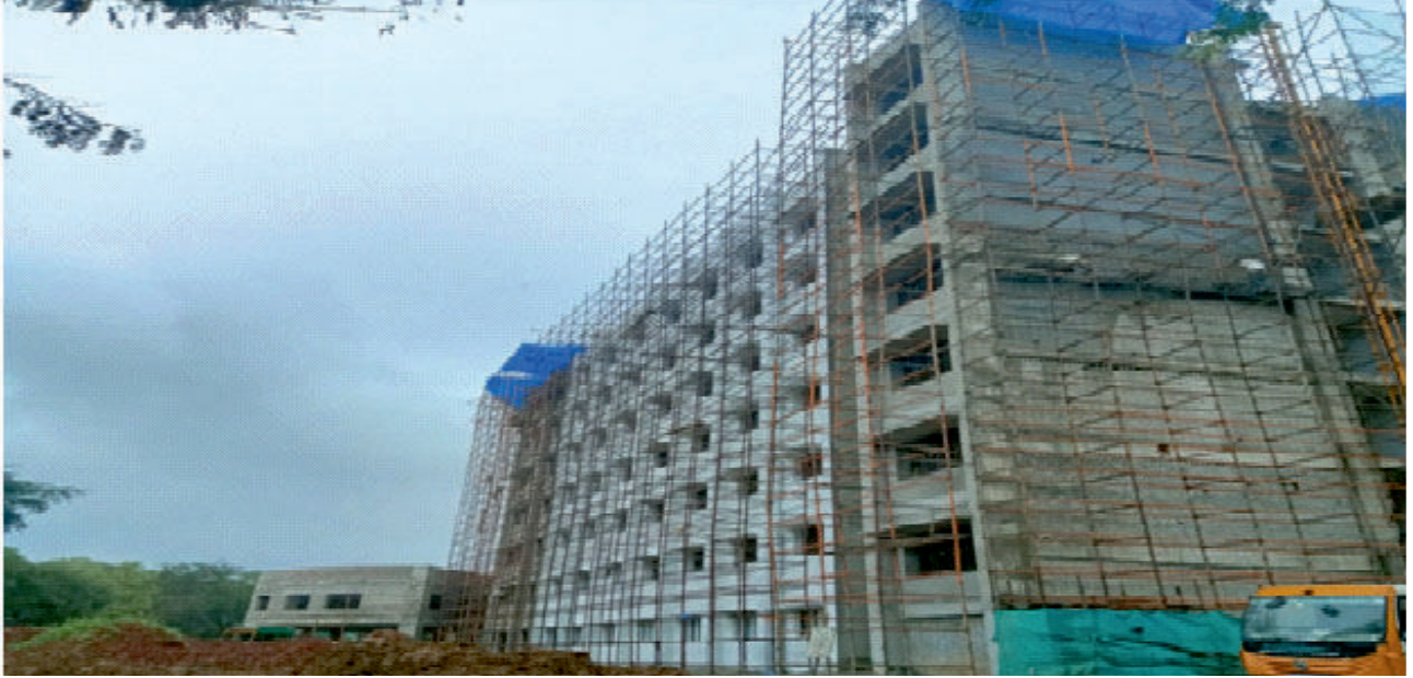
திருப்பத்தூரில் கட்டப்பட்டு வரும் மாவட்ட ஆட்சியர் அலுவலக கட்டடம்