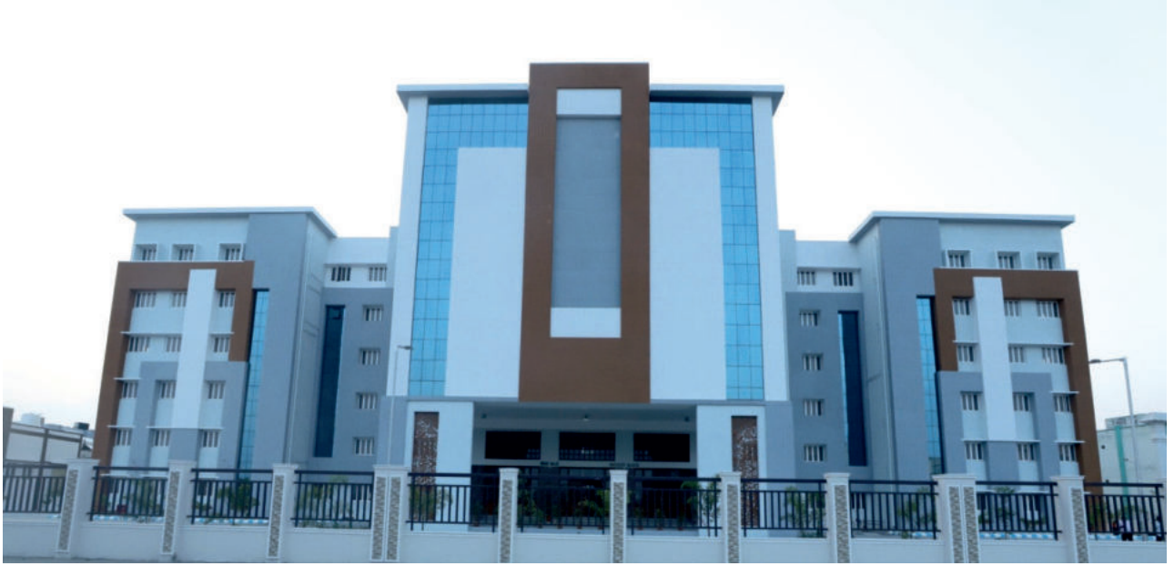
கள்ளக்குறிச்சி அரசு மருத்துவ கல்லூரி இயல் கூடம் திறக்கப்பட்ட நாள் : 12.01.2022