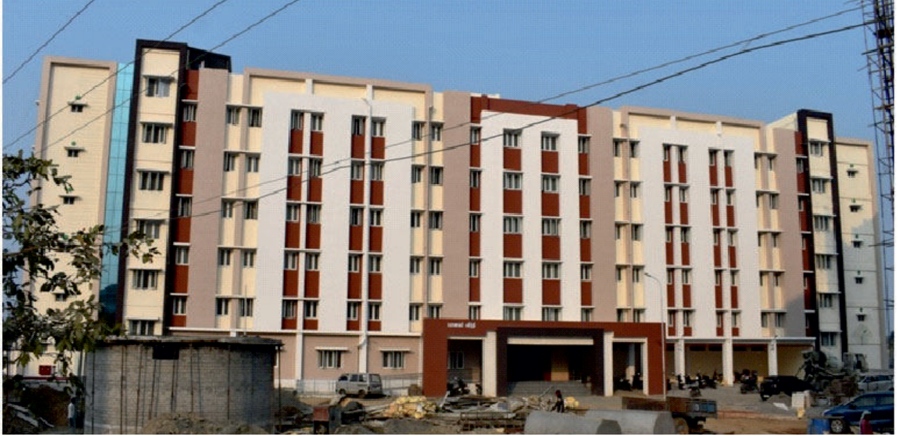
கள்ளக்குறிச்சி அரசு மருத்துவ கல்லூரி மாணவர் விடுதி திறக்கப்பட்ட நாள் : 12.01.2022