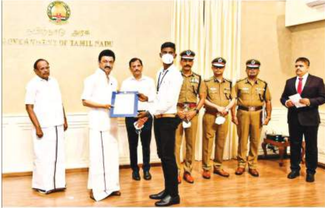
மாண்புமிகு முதலமைச்சர் அவர்களால் தீயணைப்போடுக்கான பணி நியமன ஆணை வழங்கப்பட்டது