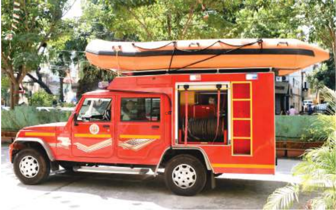
மிதவை இரப்பர் படகூடன் கூடிய துரித மீட்டி ஊர்தி