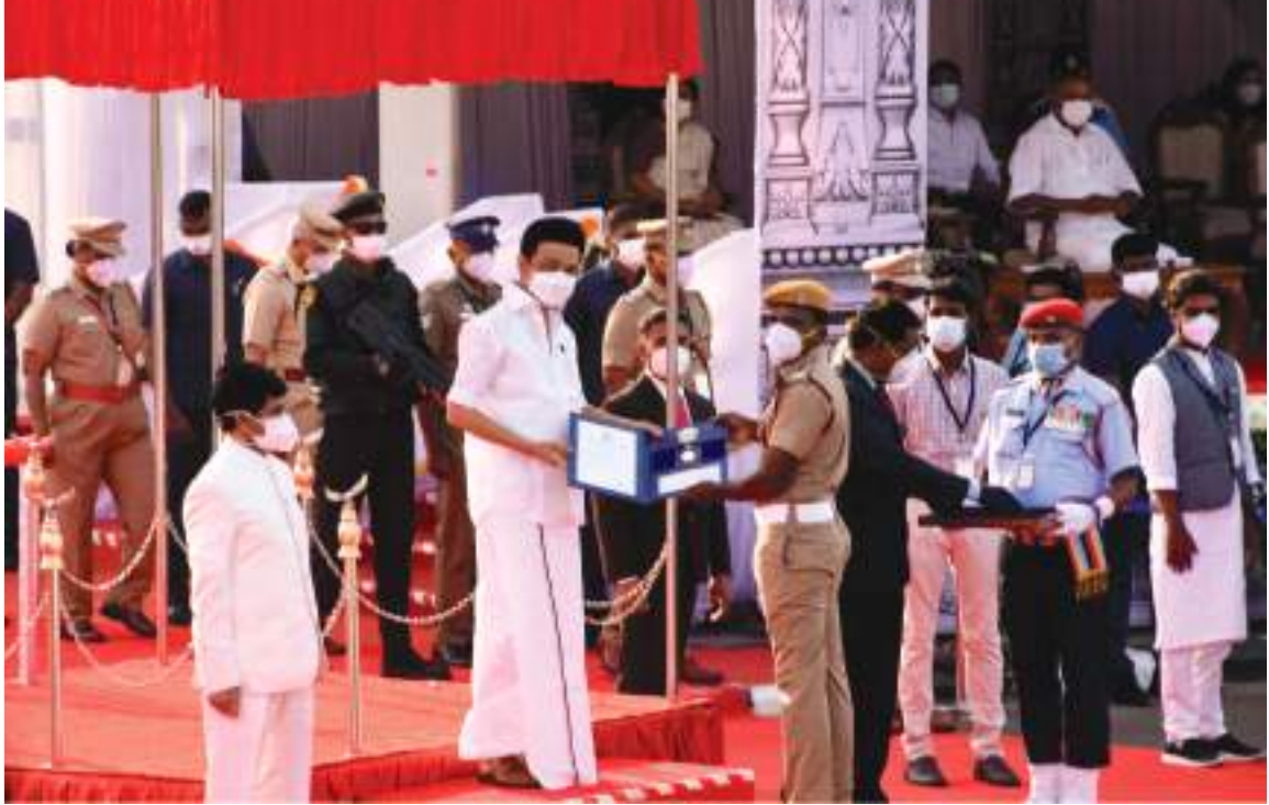
மாண்புமிகு முதலமைச்சர் அவர்களால் தீயணைப்பாளருக்கு அண்ணா பதக்கம் வழங்கப்பட்டது