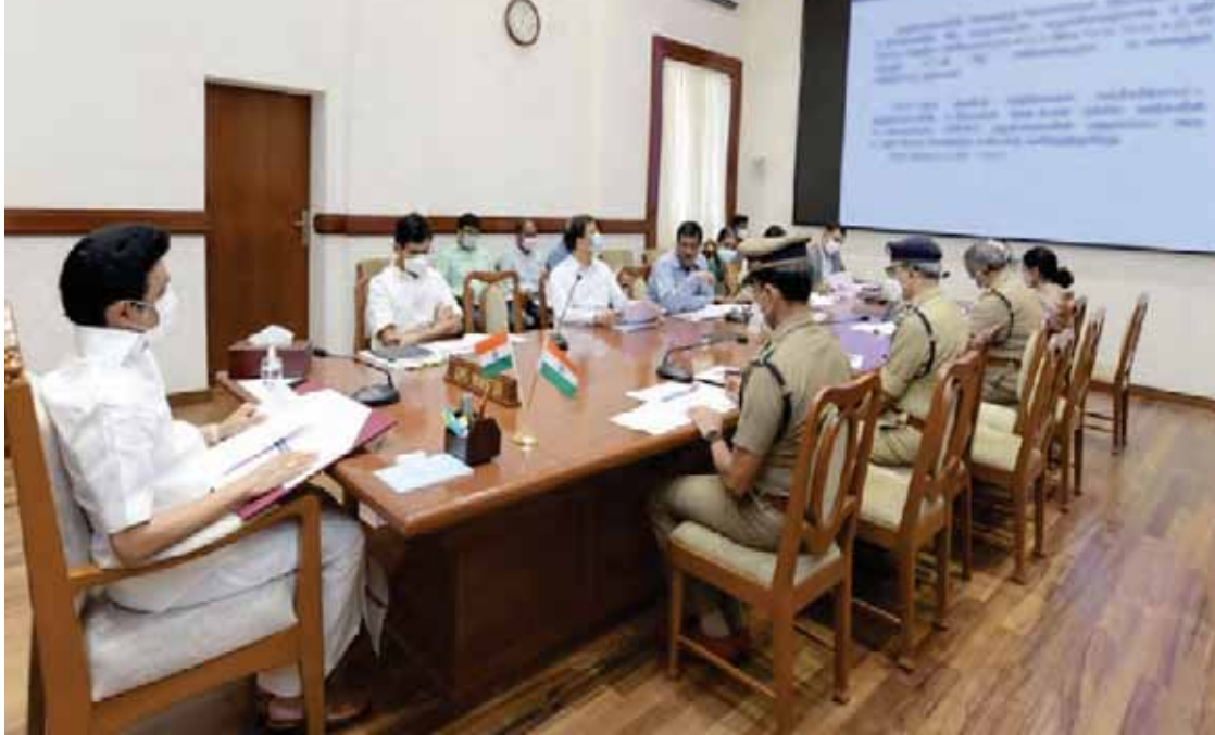
குழந்தைகளுக்கு எதிரான பாலியல் (போக்சோ) குற்றங்கள் குறித்த ஆய்வுக் கூட்டம் - 27.11.2021.