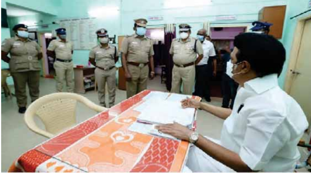
தருமபுரி மாவட்டம் அதியமான் கோட்டை காவல் நிலைய ஆய்வு - 29.09.2021.