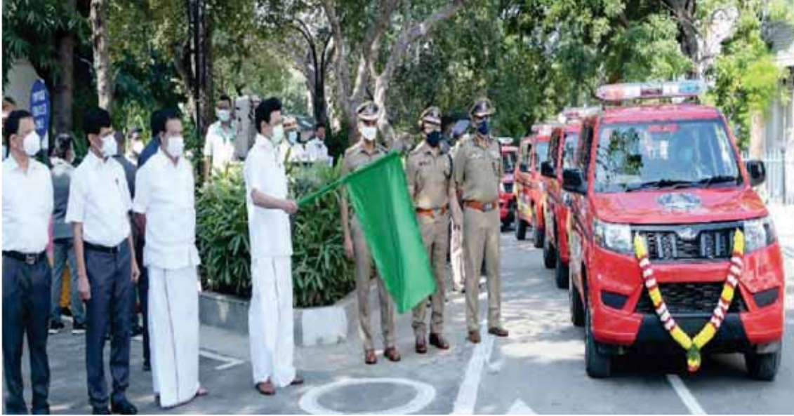
தாம்பரம் மற்றும் ஆவடி மாநகர காவல்துறையின் பயன்பாட்டிற்காக புதிய வாகனங்களைக் கொடியசைத்து துவக்கி வைத்தல் - 13.01.2022.