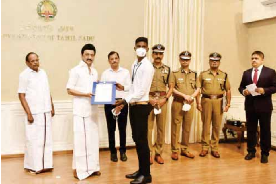
காவலர்களாக தேர்வு செய்யப்பட்டவர்களுக்கு பணி நியமன ஆணை வழங்குதல் - 08.03.2022.