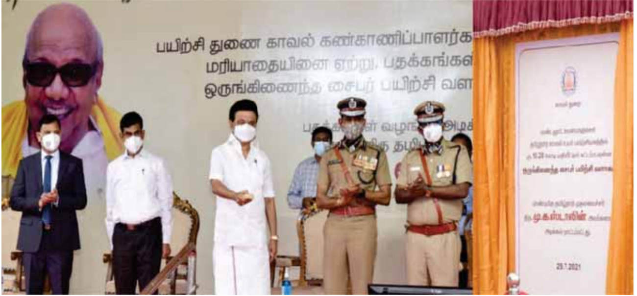
தமிழ்நாடு காவல் உயர் பயிற்சியகத்தில் ஒருங்கிணைந்த இணையதள குற்றப் பயிற்சி வளாகத்திற்கு அடிக்கல் நாட்டுதல் - 29.07.2021.