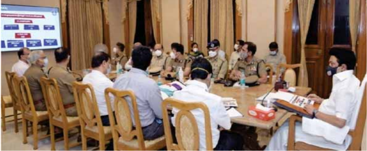
காவல்துறை செயல்பாடுகள் குறித்த ஆய்வுக் கூட்டம் - 17.07.2021.