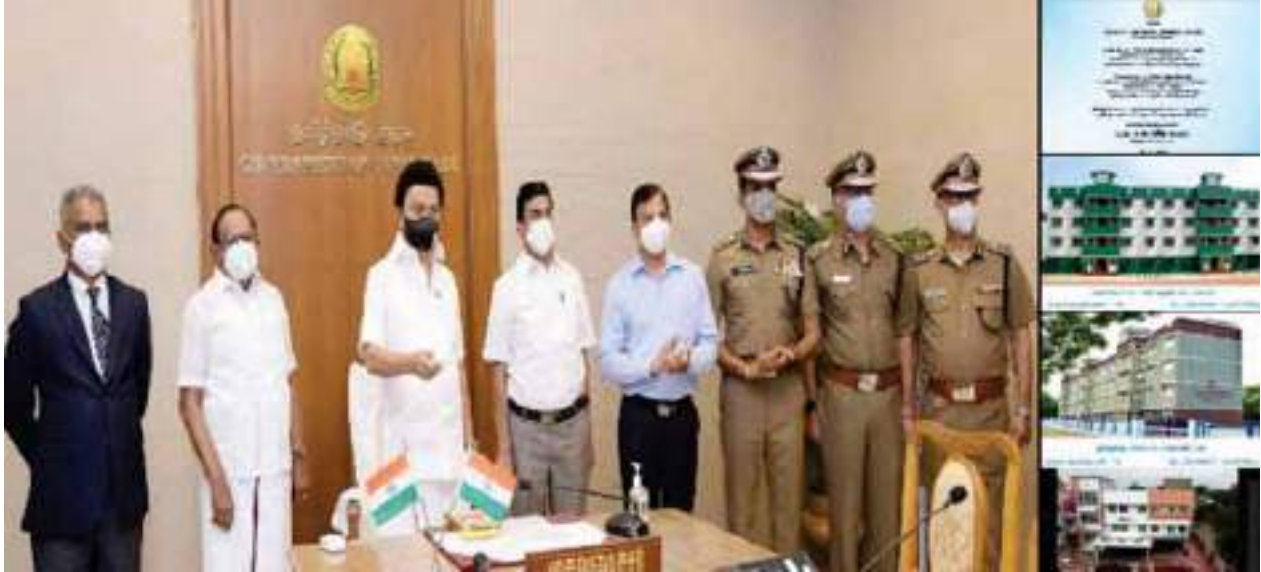
காவல் துறைக்கு புதியதாகக் கட்டப்பட்ட கட்டிடங்களைத் திறந்து வைத்தல் - 30.08.2021.