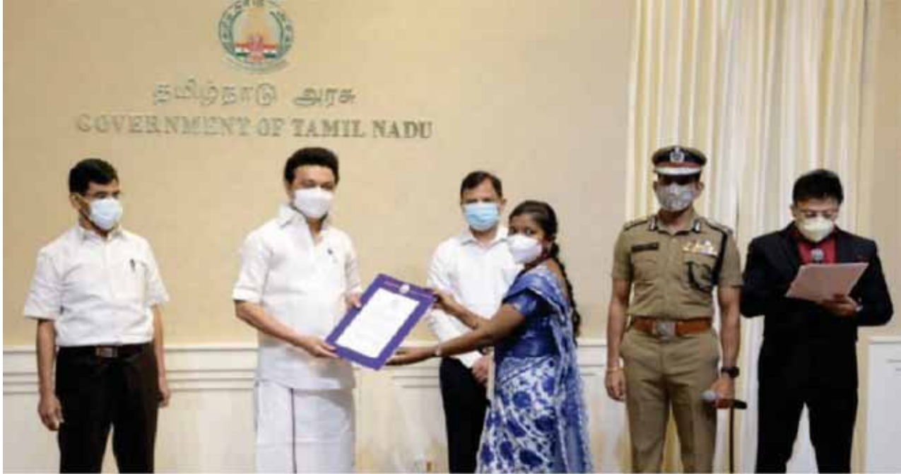
உதவி ஆய்வாளராக தேர்வு செய்யப்பட்டவர்களுக்கு பணி நியமன ஆணை வழங்குதல் - 26.07.2021.