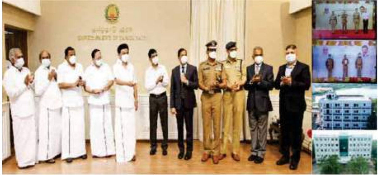
தாம்பரம் மற்றும் ஆவடி மாநகர காவல் ஆணையர்கங்களைத் துவக்கி வைத்தல் - 01.01.2022.