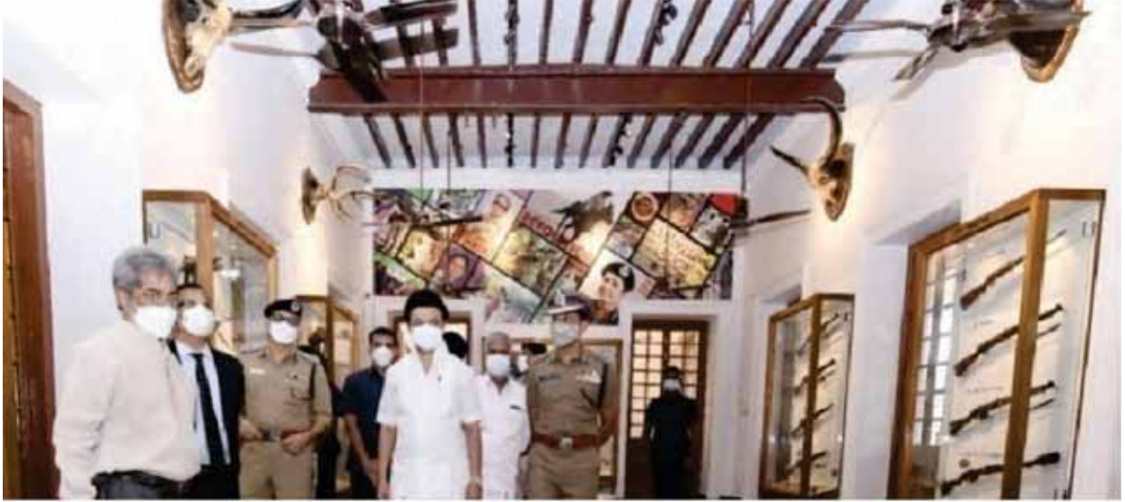
காவல்துறை அருங்காட்சியகத்தைத் துவக்கி வைத்து பார்வையிடல் - 28.09.2021.