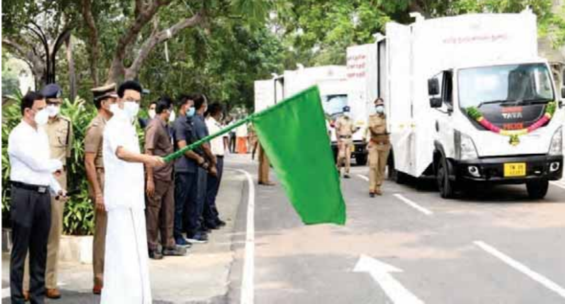
குழந்தைகளுக்கு எதிரான குற்றங்கள் பற்றிய விழிப்புணர்வு வாகனத்தைக் கொடியசைத்து துவக்கி வைத்தல் - 06.12.2021.