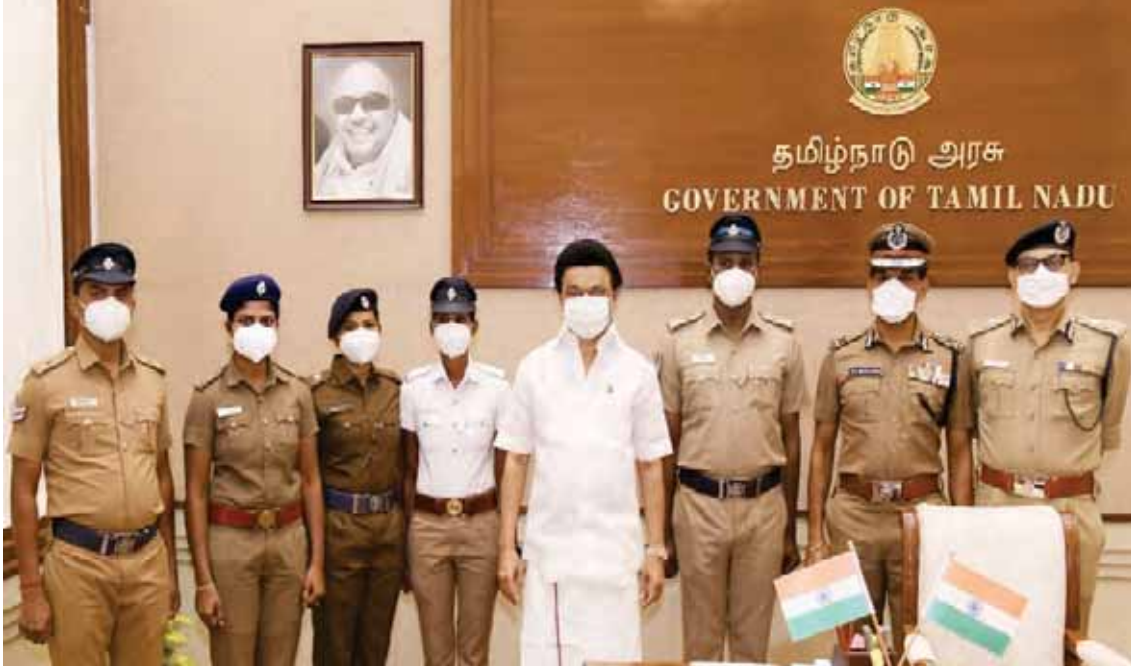
காவலர் முதல் தலைமைக் காவலர் வரை வாரத்தில் ஒரு நாள் ஓய்வு அறிவித்ததற்காக நன்றி தெரிவித்துக்கொள்ளுதல் - 06.11.2021.