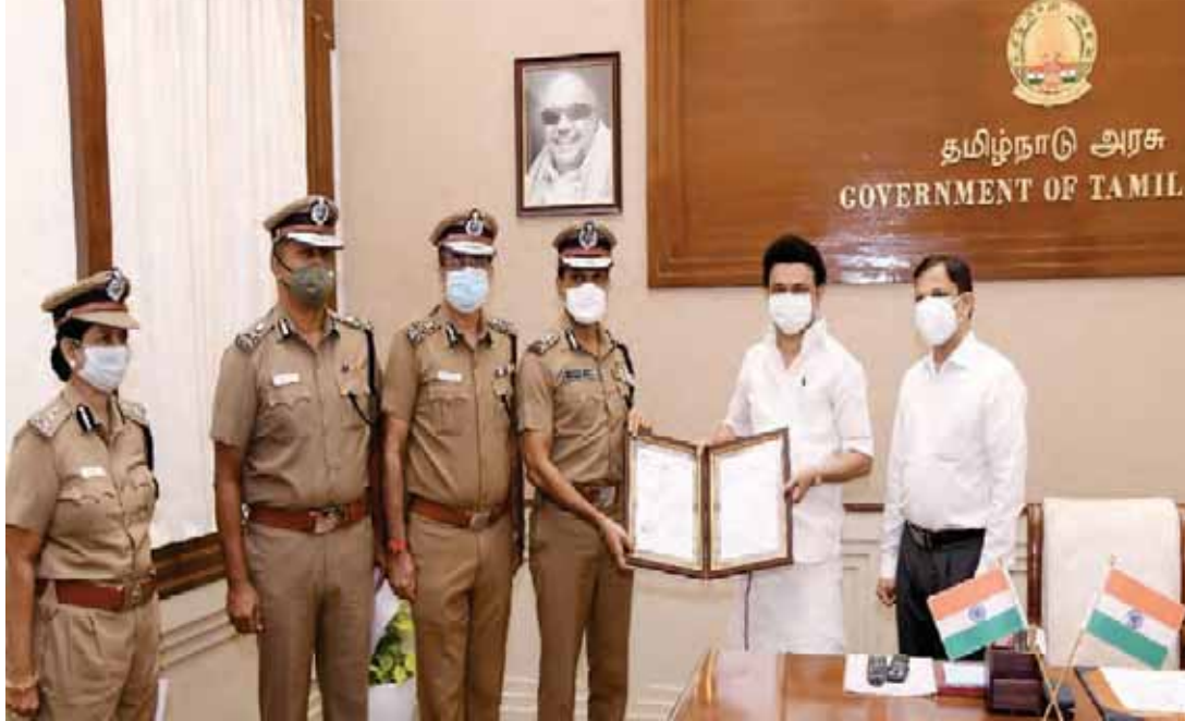
சென்னை, மாநில காவல் கட்டுப்பாட்டு அறைக்கு British Standards Institution-னால் வழங்கப்பட்ட ISO தர சான்றிதழை வழங்குதல் - 03.11.2021.