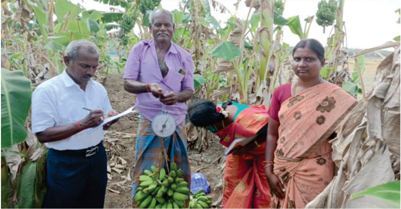
பிரதம மந்திரி பயிர் காப்பீட்டு திட்டம் - இராமநாதபுரம் மாவட்டம் - வாழைப்பயிர் அறுவடை பரிசீலனை