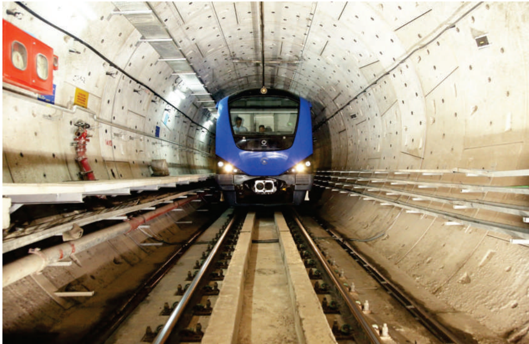
சென்னை மெட்ரோ இரயில் திட்டம் - கட்டம் -I - சுரங்கப்பாதையில் மெட்ரோ இரயில் செல்லும் காட்சி