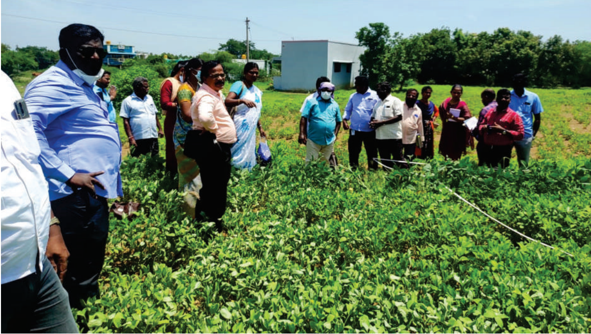
பொதுப்பயிர் மதிப்பீட்டு ஆய்வு திட்டம் களப்பயிற்சி ஆய்வு