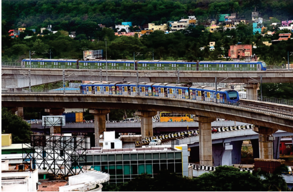
சென்னை மெட்ரோ இரயில் திட்டம் - கட்டம் - I - உயர்த்தப்பட்ட இரண்டு மெட்ரோ இரயில் வழித்தடங்கள் கத்திப்பாரா மேம்பாலத்திற்கு மேல் செல்லும் காட்சி