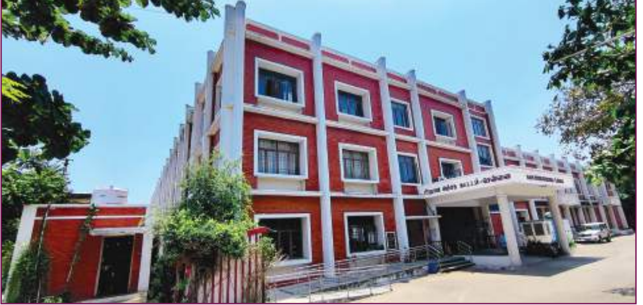
அரசு மைய அச்சகத்தின் பிரதான அச்சக கட்டடம்