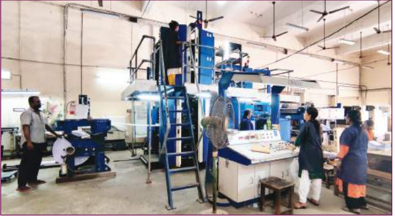
நான்கு வண்ண வெப் ஆப்செட் இயந்திரம், அரசு மைய அச்சகம், சென்னை.