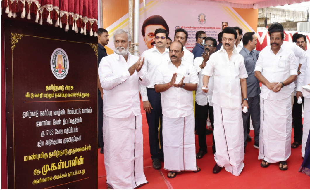
மாண்புமிகு முதலமைச்சர் அவர்களால் சென்னை ஜமாலியா லேன் திட்டப்பகுதியில் ரூ.17.63 கோடி மதிப்பீட்டில் 130 அடுக்குமாடிக் குடியிருப்புகளை மறுகட்டுமானம் செய்வதற்கு 11.06.2022 அன்று அடிக்கல் நாட்டப்பட்டது