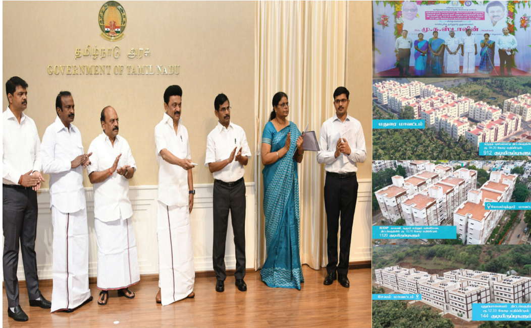
மாண்புமிகு முதலமைச்சர் அவர்கள் ரூ.405.90 கோடி செலவில் 8 மாவட்டங்களில் 15 திட்டப்பகுதிகளில் கட்டப்பட்டுள்ள 4644 அடுக்குமாடிக் குடியிருப்புகளை 07.12.2022 அன்று திறந்து வைத்தார்கள்