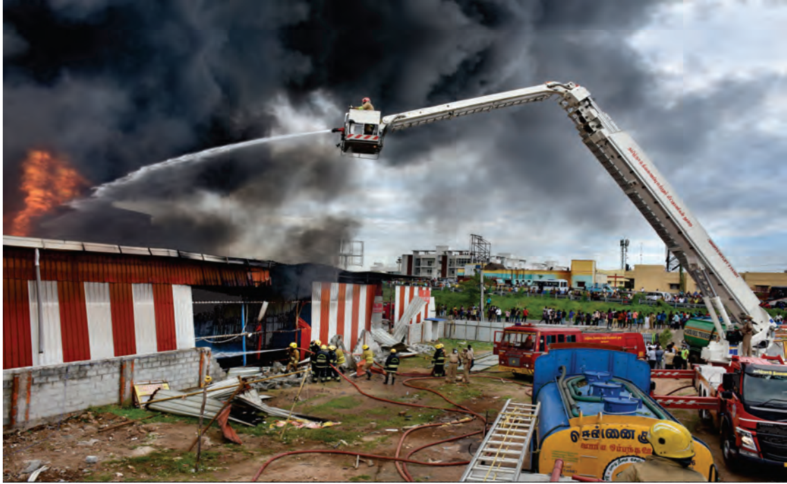
திரைப்பட அலங்காரப் பொருட்கள் சேமிப்பு கிடங்கில் ஏற்பட்ட தீயை அணைக்கும் பணி