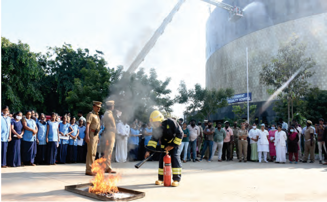
அரசு பன்னோக்கு மருத்துவமனையில் நடைபெற்ற தீத்தடுப்பு ஒத்திகை நிகழ்ச்சி