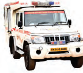
சிறியரக நீர்தாங்கி ஊர்தி