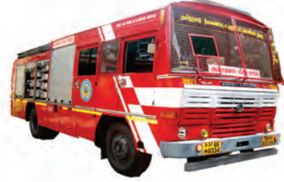
அவசரகால மீட்டிங் ஊர்தி