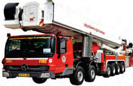
வான்நோக்கி உயரும் ஏணி கொண்ட ஊர்தி