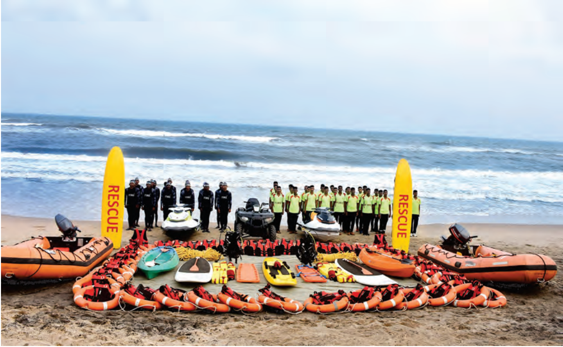
மீட்புப் பணிகள் குழு - சென்னை மெரினா கடற்கரை