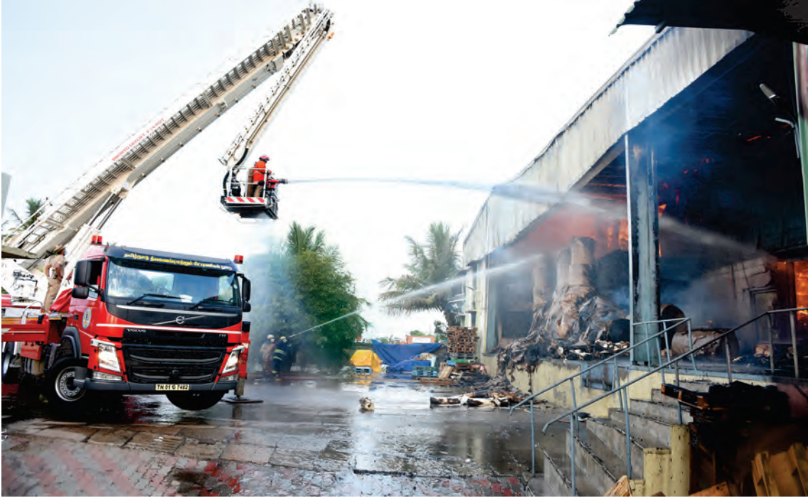
காகிதப் பொருட்கள் சேமிப்பு கிடங்கில் ஏற்பட்ட தீயை அணைக்கும் பணி