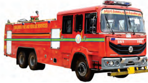
தண்ணீர் பெரும லாரி

தீயணைப்பு மற்றும் மீட்டிங் பணிகள் வாகனங்கள்