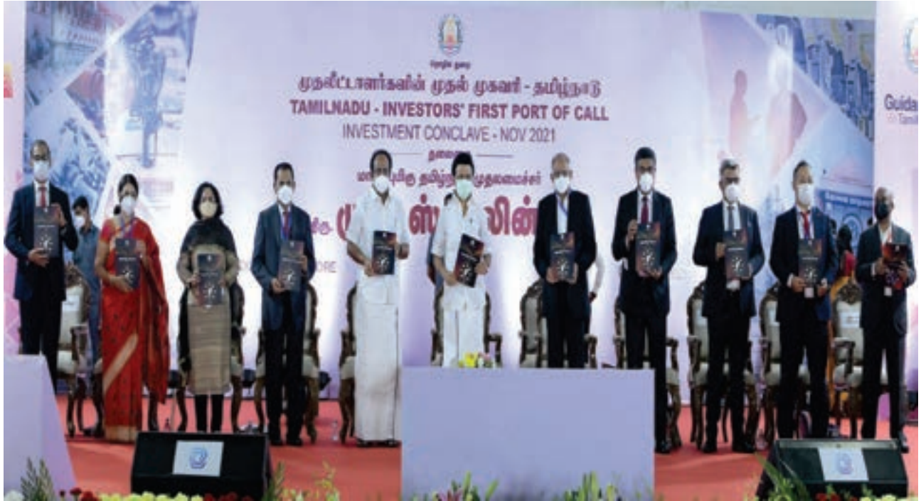
மாண்புமிகு முதலமைச்சர் அவர்கள் 23.11.2021 அன்று நடைபெற்ற முதலீட்டாளர்களின் முதல் முகவரி – தமிழ்நாடு மாநாட்டில் “தமிழ்நாடு நிதிநுட்பக் கொள்கை 2021”-ஐ வெளியிட்டார்கள்