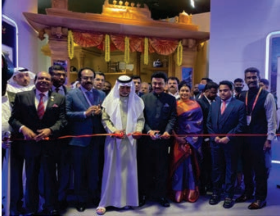
மாண்புமிகு முதலமைச்சர் அவர்கள் 25.03.2022 அன்று துபாய் உலக கண்காட்சியில் தமிழ்நாடு அரங்கினை திறந்து வைத்தார்கள்