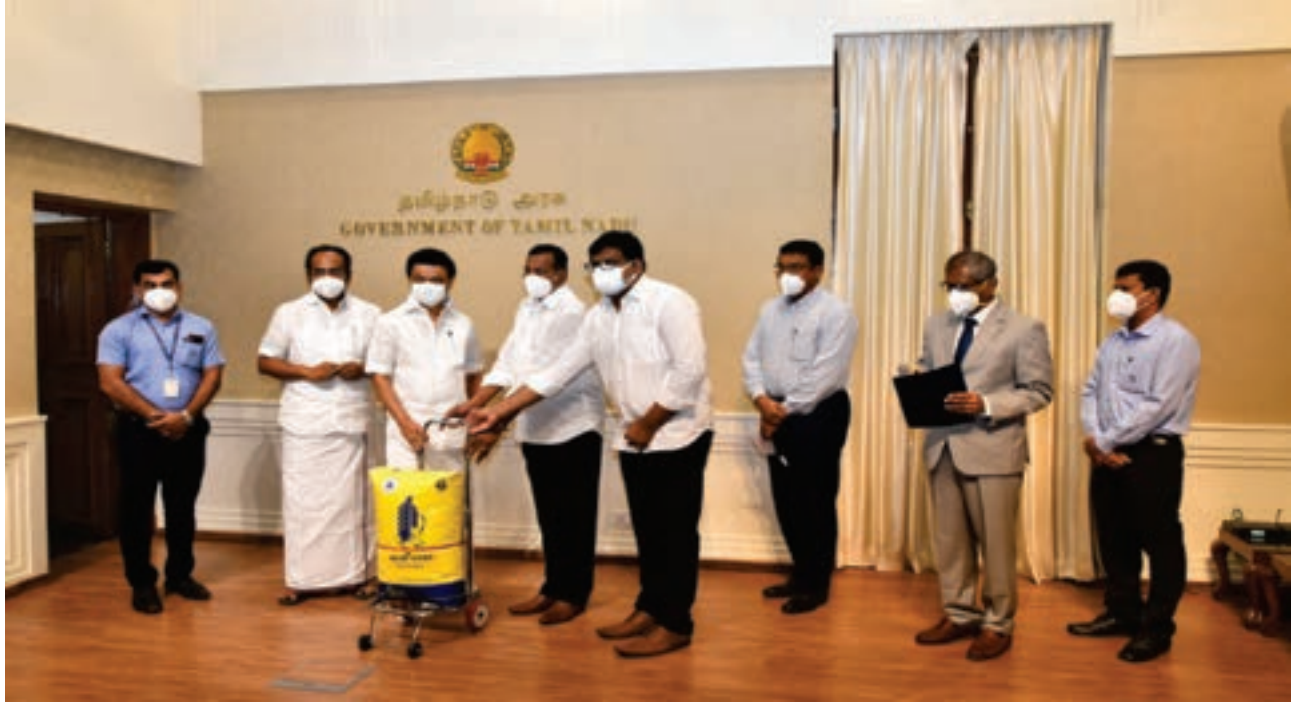
புதிய ரக உயர்தர வலிமை சிமெண்டை 16.11.2021 அன்று மாண்புமிகு தமிழக முதலமைச்சர் அவர்கள் அறிமுகப்படுத்தினார்கள்