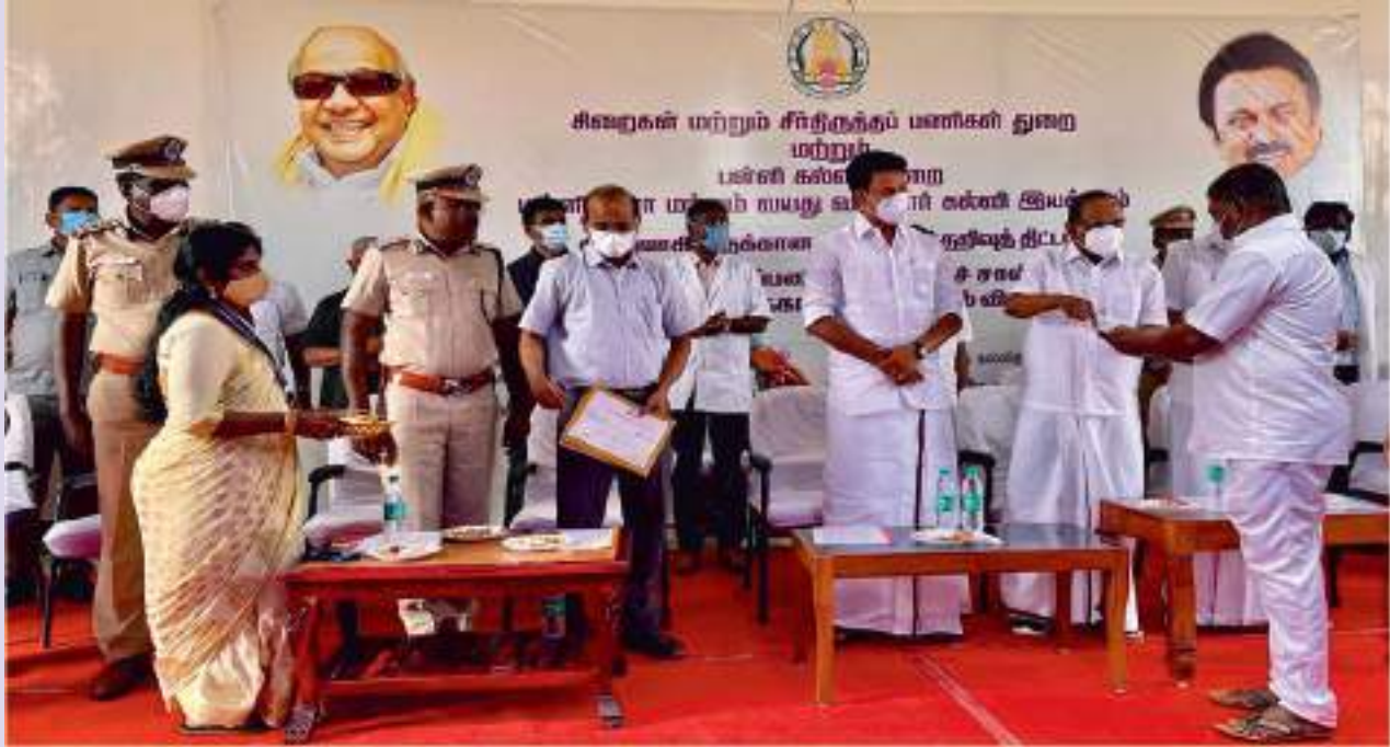
05.01.2022 அன்று பள்ளி சாரா மற்றும் வயதுவந்தோர் கல்வி இயக்ககம் சார்பில் புழல் மத்திய சிறை - இல் சிறைவாசிகளுக்கு சிறப்பு எழுத்தறிவுத் திட்ட சான்றிதழ் மற்றும் நூலக புத்தகம் மாண்புமிகு சட்டம் மற்றும் பள்ளிக் கல்வித் துறை அமைச்சர்களால் வழங்கப்பட்டது.