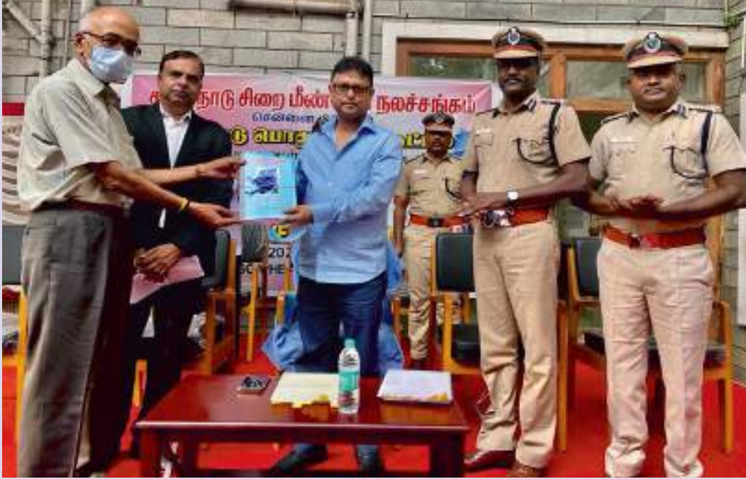
தமிழ்நாடு சிறை மீண்டோர் நலச் சங்கத்தின் ஆண்டு பொதுக்குழுக் கூட்டம் 10.12.2021 அன்று சிறைகள் மற்றும் சீர்திருத்தப் பணிகள் துறை தலைமை இயக்குநர் அலுவலகம், எழும்பூர், சென்னை-8இல் நடைபெற்றது.