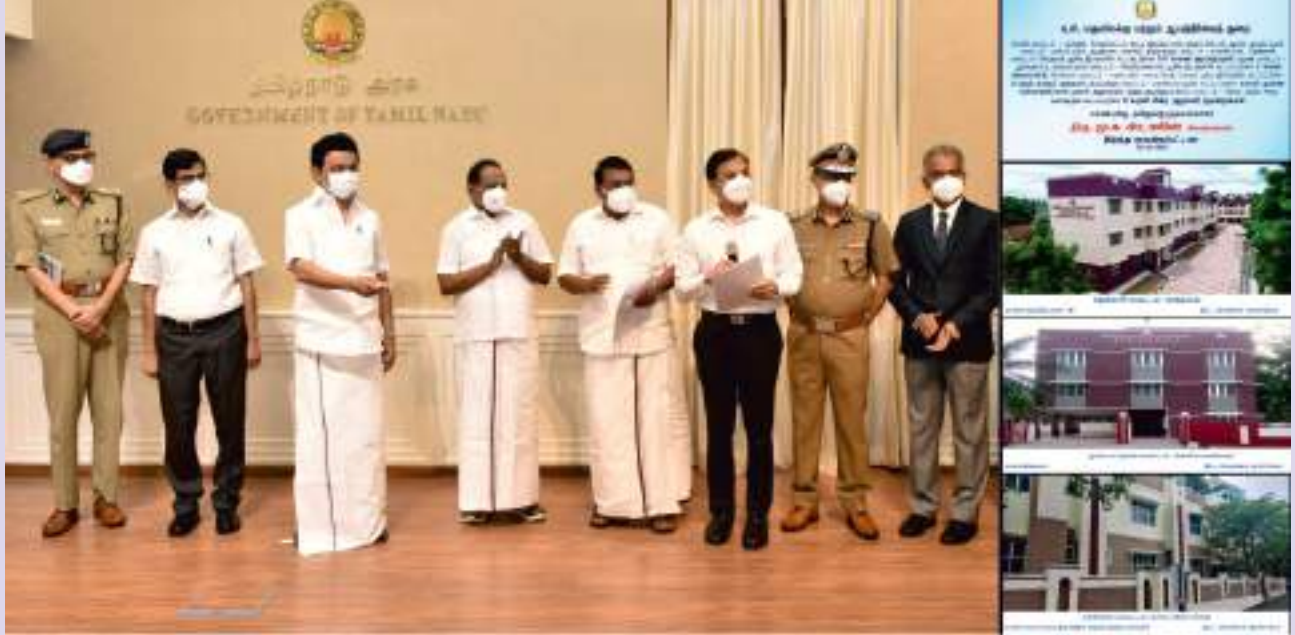
மாண்புமிகு தமிழ்நாடு முதலமைச்சர் அவர்கள் 20.11.2021 அன்று கோவை மத்திய சிறை வளாகத்தில் ரூ.127.97 இலட்சம் மதிப்பீட்டில் கட்டப்பட்டுள்ள 6 உதவி சிறை அலுவலர் குடியிருப்புகளைத் திறந்து வைத்தார்