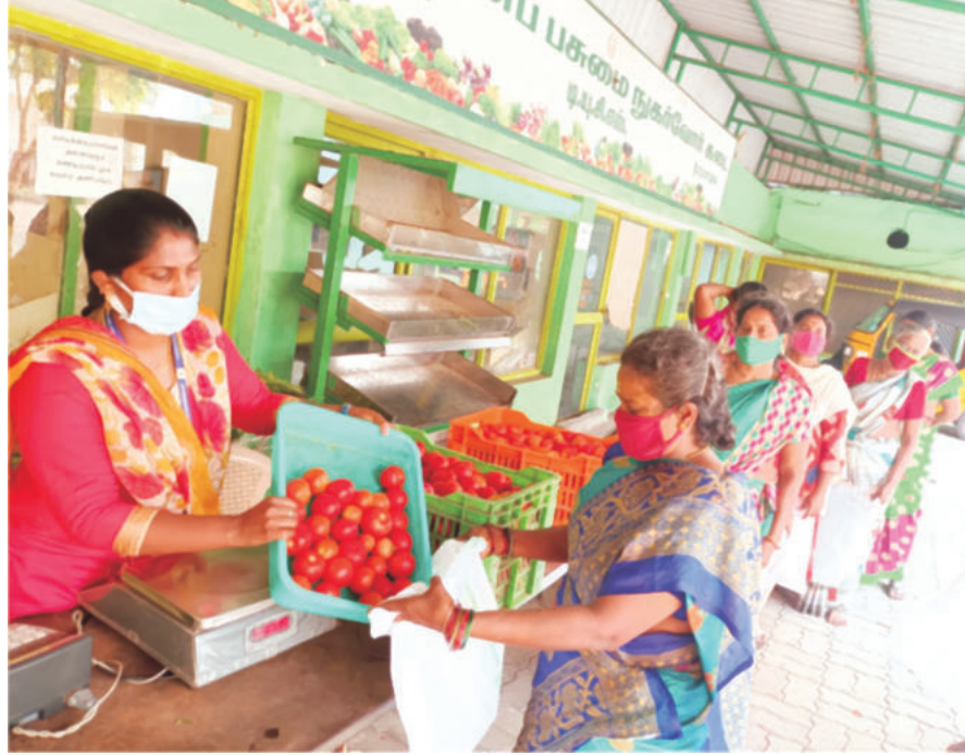
டி.யூ.சி.எஸ். பண்ணைப் பசுமை நுகர்வோர் கடையில் மலிவு விலையில் தக்காளி விற்பனை