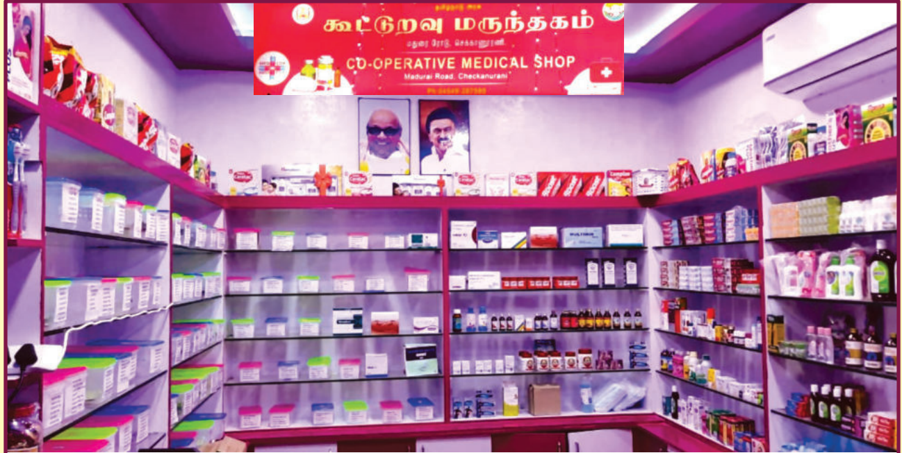
மதுரை மாவட்டம் செக்காணூரணியில் புதியதாக கட்டப்பட்டுள்ள கூட்டுறவு மருந்தகம்