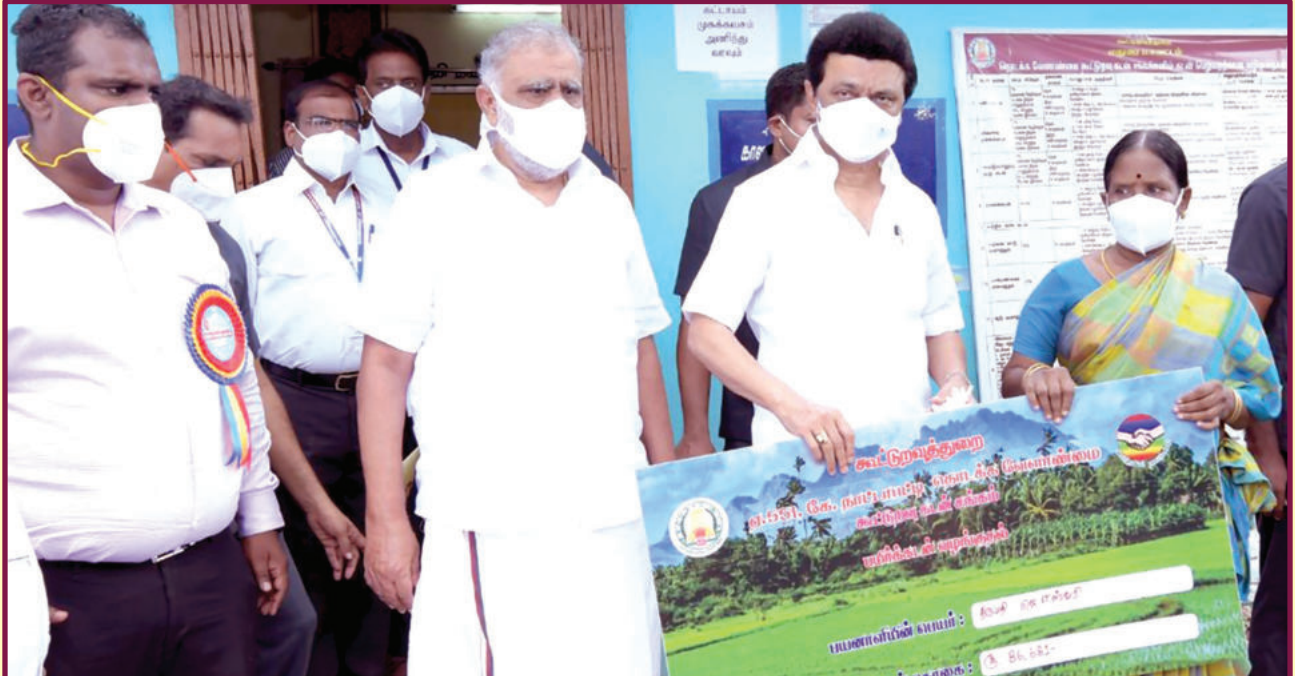
மாண்புமிகு தமிழ்நாடு முதலமைச்சர் திரு. மு.க.ஸ்டாலின் அவர்கள் 2.10.2021 அன்று மதுரை மாவட்டம், செல்லம்பட்டி ஊராட்சி ஒன்றியம், கே.நாட்டாபட்டி கிராமத்தில் உள்ள தொடக்க வேளாண்மைக் கூட்டுறவுக் கடன் சங்க அலுவலகத்திற்கு நேரில் சென்று ஆய்வு மேற்கொண்டபோது, பயனாளிகளுக்கு பயிர்க் கட்டுக்கான காசோலைகளை வழங்கினார்.