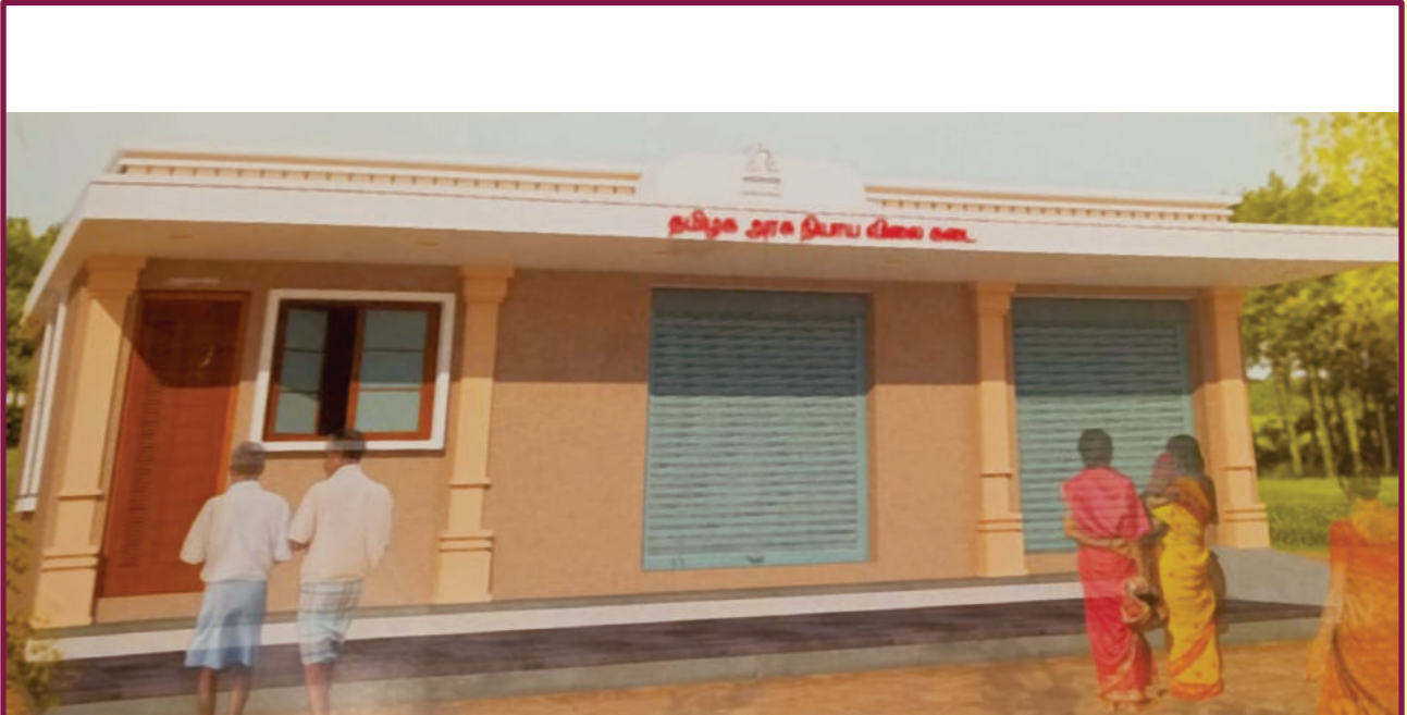
புதியதாக கட்டப்படவுள்ள பொதுவிநியோகத் திட்ட நியாயவிலைக்கடையின் மாதிரி வடிவமைப்பு